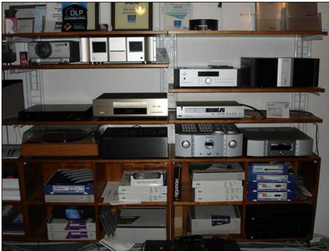
Den herlige reol med alle de andre spændende ting, demo og brugt såvel som nyt, heriblandt Accuphase DP-57 og de dyreste MIT-kabler.

R.A.B.O.S. fik jeg en interessant demonstration af ude i selve butiklokalet hvor det alt andet lige er en større udfordring at hive vellyd ud af systemet pga. alle de forskellige faktorer der nu engang spiller ind når der står så mange ting i nærheden.