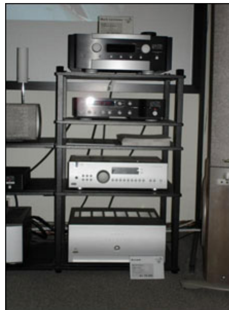
Mark Levinson No. 383, Mark Levinson No. 390s, samt Arcam FMJ surround

Demo-rummet er i øvrigt meget spændende da der står en masse andet spændende grej derinde. Jeg fik en forrygende demonstration af den nye Harman/Kardon AVR-7300 og dens evner til at switche video-signaler op til 1080, dvs. HD-kvalitet. Her blev vist nogle forskellige sekvenser fra film og signalet blev kørt ud gennem en Infocus 5705 projektor, og billedet var i den grad helt i topklasse. Omskiftningen mellem de forskellige video-formater tog i øvrigt kun få sekunder i 7300 ´eren og forskellen var absolut til at se. Til prisen må AVR-7300 absolut være et hit for alene billedkvaliteten er i topklasse. Indeni finder man Faroudjas DCDi-scaler i nyeste generation og den klarer opskalering til 576 progressiv og switcher signaler op til 1080 interlaced. Tilslutningerne er HDMI og komponent. Bassen koster 19.995,00 og må absolut siges at give valuta for pengene. Billedet blev leveret fra bl.a. Onkyo Integra DV-939 til 24.995,00 kr. samt parabol med HD-feed.