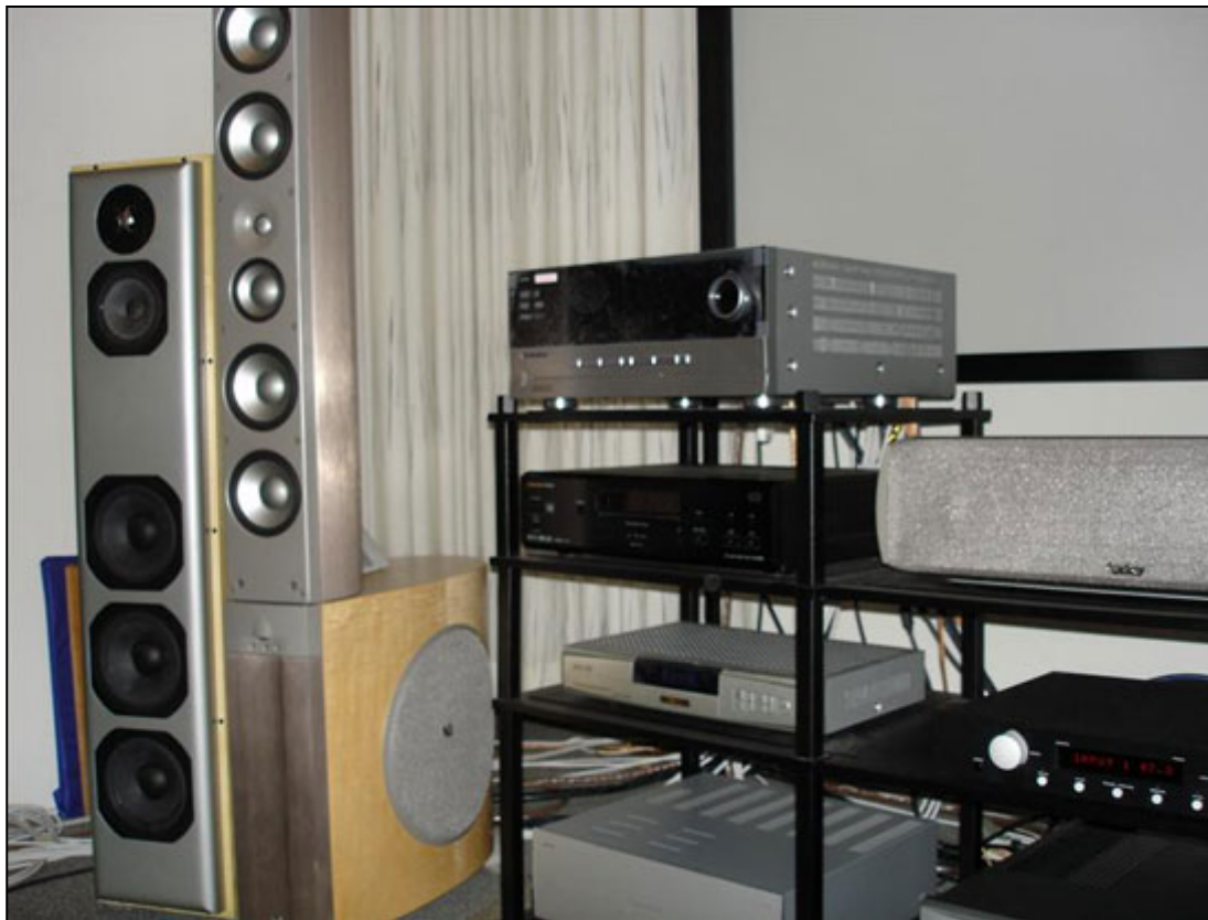
Revel Performa F50, Infinity Prelude, Harman/Kardon AVR-7300, Mark Levinson No. 326s, Infinity Prelude Center samt Onkyo DV-939

I systemet stod også Infinitys Prelude PMTS-tower med de matchende aktive subwoofere styret af forstærkere på ikke mindre end 850 watt og R.A.B.O.S rumoptimering. Prelude PMTS-systemet koster 100.000,00 kr. sættet og der var desuden den matchende center-højtaler til 14.999,00 kr.