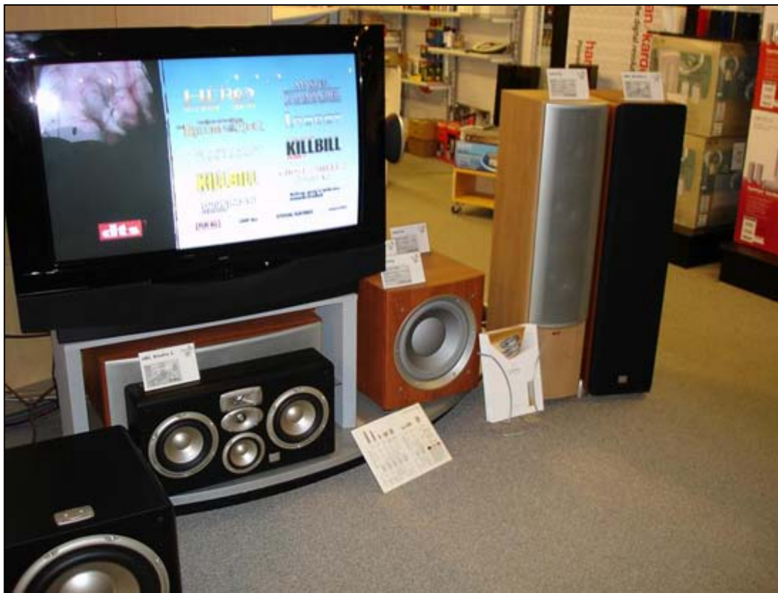
Studio L-series sub, center og fronthøjtaler.

Hele systemet var drevet af en Harman/Kardon DVD-22 og AVR-240 på "sølle" 7x50 watt. Det viste sig dog at være rigeligt da højttalerne i den grad er effektive. AVR-240 koster 5.799,00 kr. og har desuden tilslutning for Ipod. Så kan man hurtigt få sine MP3 afspillet på hjemmesystemet hvis man ikke ønsker at bruge tiden på at skifte plader. DVD-22 koster 2.499,00 kr. og er den perfekte partner til en AVR-240. I øvrigt er alle modeller i Harman/Kardons surround-serie at finde i butikken inklusive den digitale DPR-2005 til 10.999,00 kr.