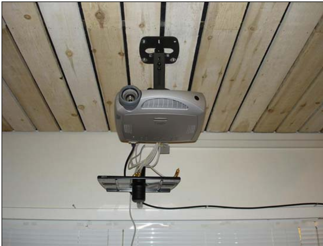
Infocus 5700 - den projektor leverer varen