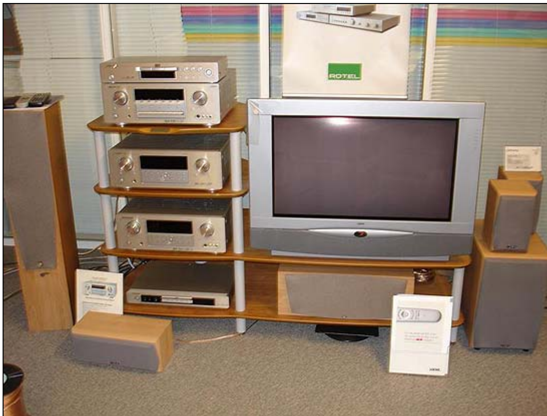
Marantz SR-4400, SR-4500 og SR-5400 samt CD-5400