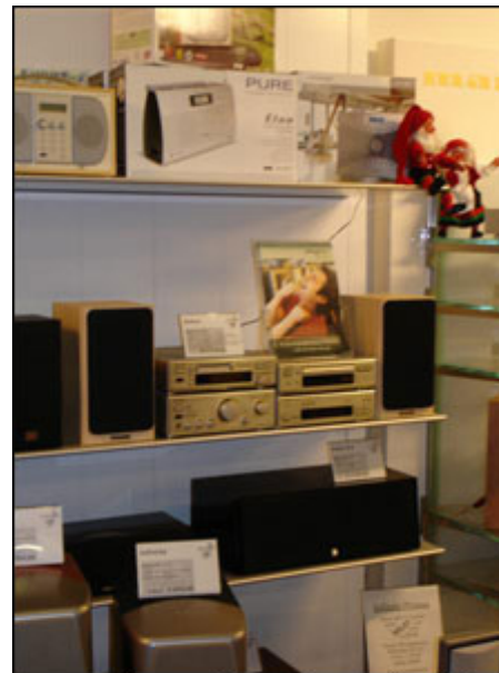
Mini-anlægget fra Onkyo- selv sådan en lille spilledåse kan være seriøs.