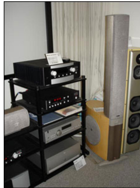
Levinson, Arcam, Infinity og Revel

I den modsatte side af demo-rummet var der LG 37" LCD RZ-37 LZ31 til 21.995,00 som er et 8 ms panel med 1366x768 progressive opløsning samt naturligvis HD-ready. Under dette tv var der blandt andet Arcams SOLO-system til 12.900,00 kr. der er en kombineret forstærker/cd-afspiller/DAB-tuner i et lækkert design, samt både DIVA A80 forstærkeren til 7.800,00 kr. og FMJ A32 forstærkeren til 15.800,00 kr. i samspil med DIVA CD-73T cd-afspilleren til 5.800,00 kr.