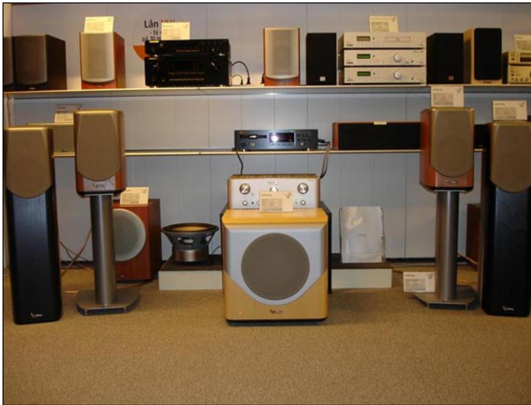
Marantz og Infinity-systemet hvorpå der blev demonstreret R.A.B.O.S.

På reolen bag systemet var der desuden et bredt udvalg af andre ting til menneskepenge, blandt andet et komplet system fra Acoustic Solutions med forstærker, cd-afspiller og DAB-tuner til under 5.000 kr. Marantz var også repræsenteret i den venlige del af skalaen med CD-5400 til 1.999,00 kr. og den matchende stereo-receiver SR-4320 til 2.999,00 kr. og ved siden af det system stod Infinity Beta 10 og 20, som er reolhøjtalere til hhv. 1.349,00 og 1.649,00 kr. stk. Onkyo havde et enkelt mini-system med separate komponenter bestående af A-921 forstærkeren på 2x50 watt, T-422 tuneren med RDS, CD-721 cd-afspilleren med 1-bit DAC og MD-121 mini-disc-afspilleren i lækker guld-finis med alu-front til 8.499,00 kr. Dette system må absolut være sagen for dem der vil have et fint anlæg uden at det dominerer stuen.