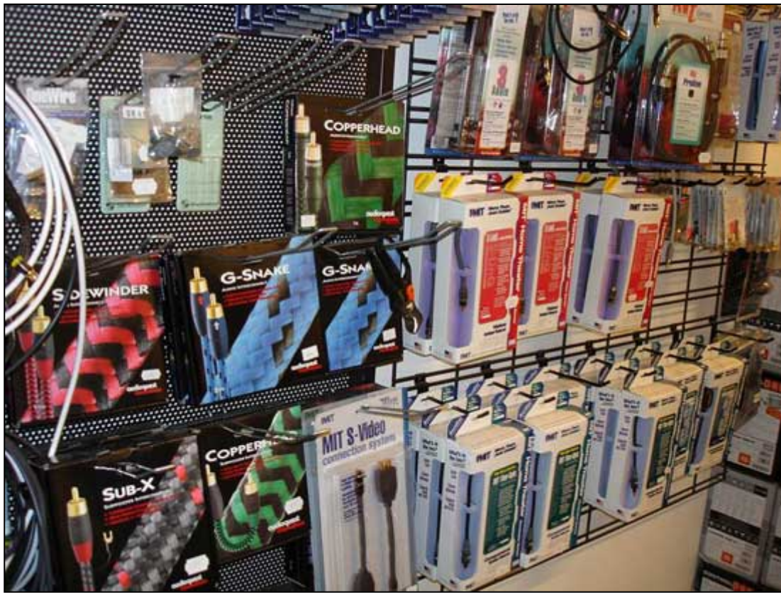
Audioquest og MIT i stort set alle afstøbninger