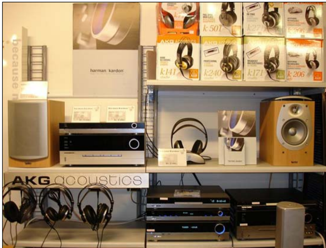
Harman/Kardon og AKG-udvalg. Audiovision gør meget i hovedtelefoner osv.