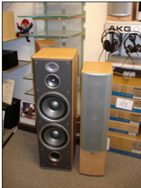
JBL Northridge og Infinity Beta - højttalere der er til at betale.