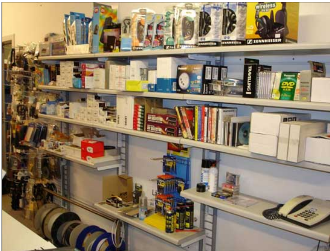
Ekstra tilbehør - du siger bare til :O)